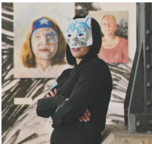
Výtvarnice Toy_Box na jednom ze svých workshopů.